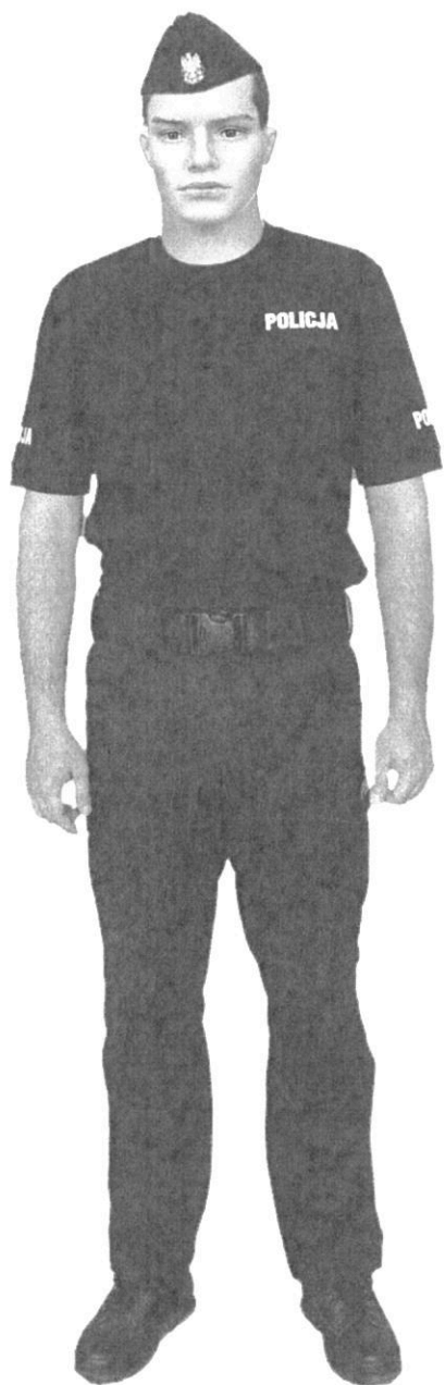
Ubiór policjanta w spodniach ćwiczebnych i koszulce z krótkim rękawem T-shirt