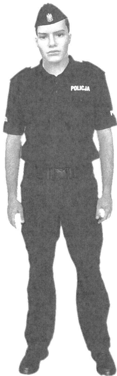
Ubiór policjanta w spodniach ćwiczebnych i koszulce polo z krótkim rękawem