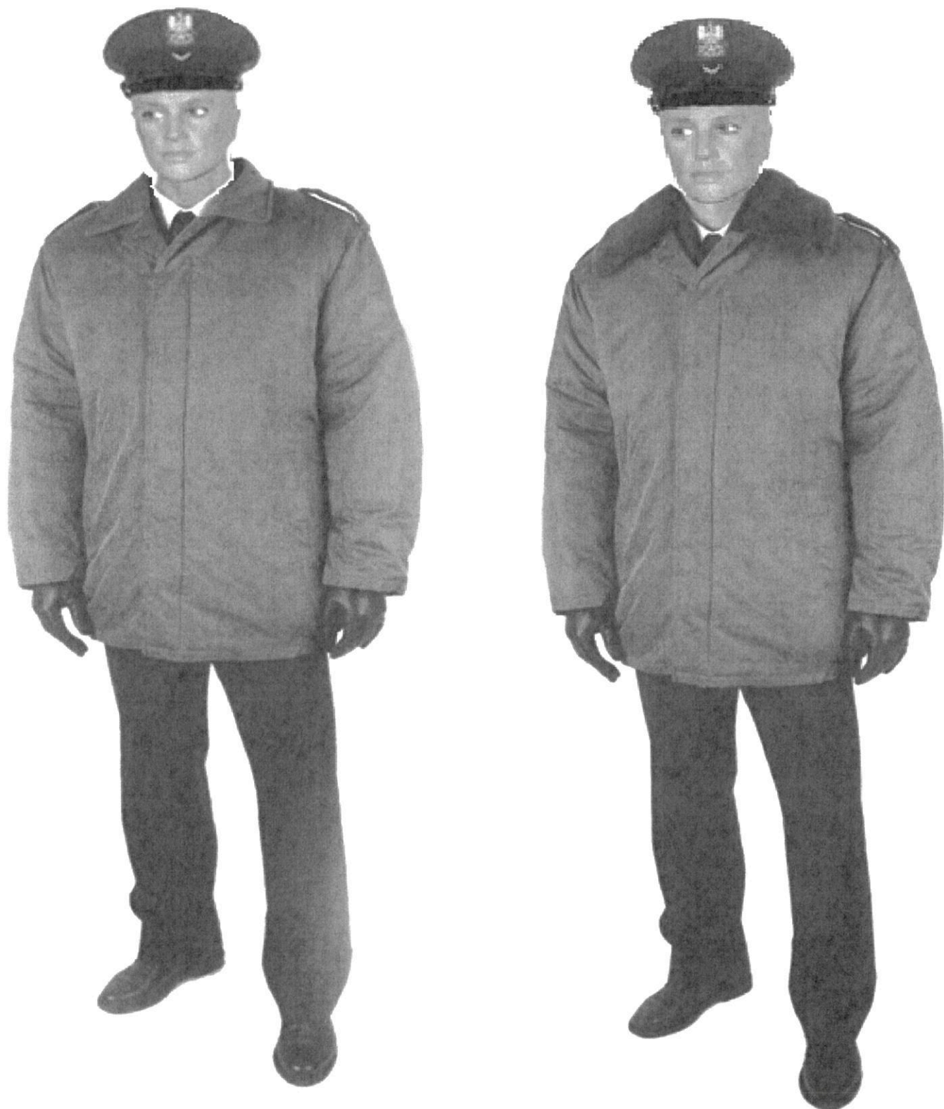
Ubiór policjanta w kurtce \frac{3}{4} z podpinką