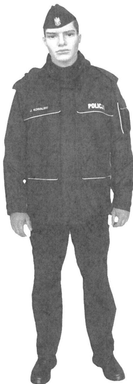
Ubiór policjanta w kurtce służbowej letniej